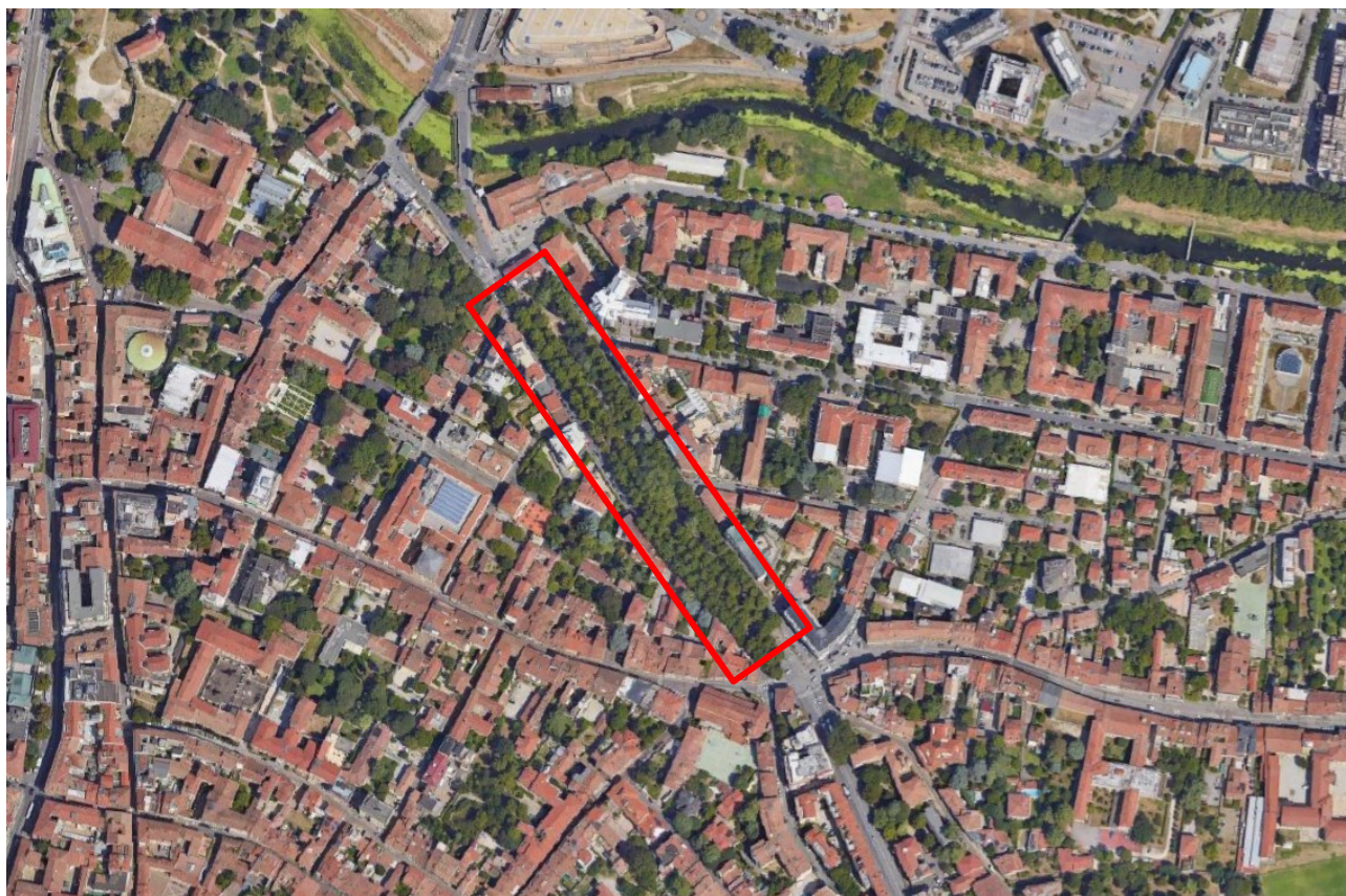
Figura 1: area oggetto di sopralluogo

Si riporta di seguito un'immagine che delinea l'area oggetto dell'intervento.